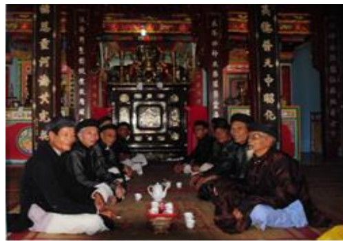
Hình 5. Tân Kỳ Cựu Viên Chức tại Lăng Ông – Thôn Tây – An Vĩnh Ảnh: Duy Đoài, năm 2012