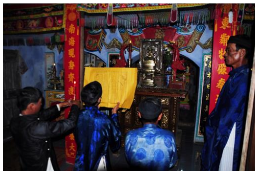
Hình 4. Đọc bài văn tế cúng Cá Ông tại Lăng Ông Hải Anh Vinh Nhân Ngày Kỳ Ông 19/3/2012. Ảnh: Duy Đoài năm 2012