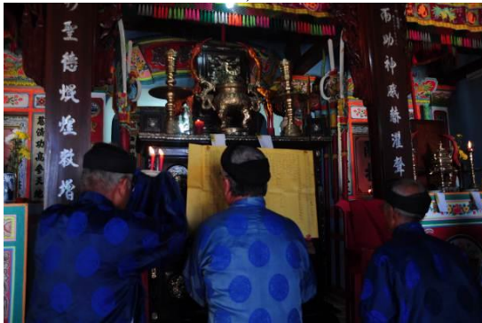
Hình 3. a. Sơ đồ phối thờ tại Lăng Ông - xã An Vĩnh b. Phối thờ tại Lăng Ông - xã An Vĩnh Ảnh: Duy Đoàn, năm 2016

Ngoài ra, trong Lăng, Lân có nhiều hoành phi, câu đối ca ngợi sự hiển linh và công đức của vị thần Nam Hải đã được cư dân, ngư dân mang đến phụng cúng như: