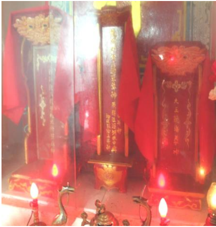
Hình 1. Bài vị tại Lăng Đại Tướng – Thôn Tây – An Vĩnh. Năm 2015.